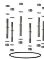
07.501 Kit de substituição (Ignis)