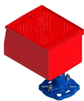
Europa / Porto