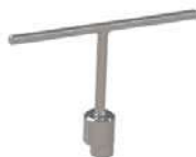
07.500 Chave para tampão storz inviolável