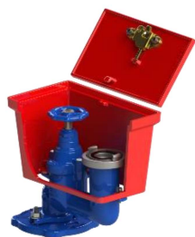
Europa / Storz