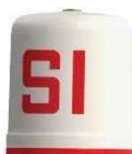
07.100A Capacete Marco de Incêndio (Somepal)