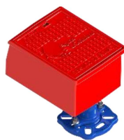
Europa / Coimbra