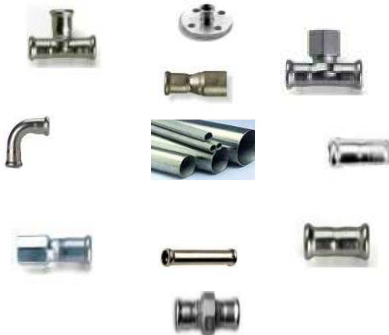
Tabela de Preços Inox Prensar Numpress

Rua das Terras da Eira,40 2700 – 812Amadora Tel.:214914016